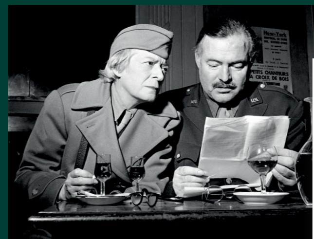
Ernest Hemingway aux Deux Magots, 1945