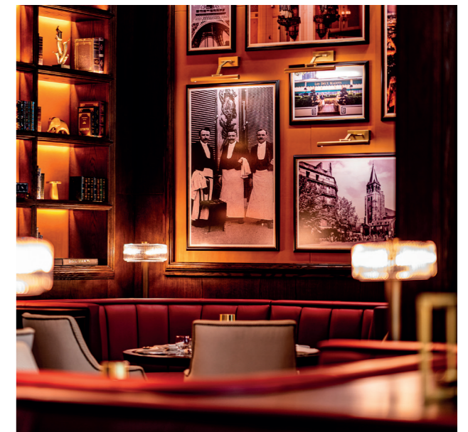
Les Deux Magots à Riyad