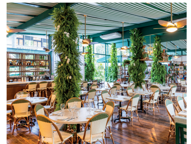
Les Deux Magots à São Paulo