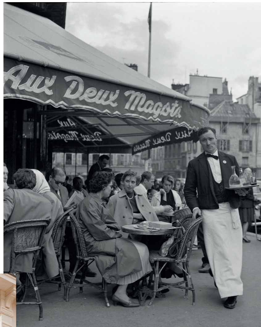
Paris, Les Deux Magots, 1955

Les Deux Magots incarne depuis plusieurs décennies la frénésie parisienne, son élégance et sa vie culturelle. L'établissement voit le jour en tant que magasin de nouveautés avant de se transformer en Café liquoriste en 1884, attirant aussitôt artistes et intellectuels en quête d'inspiration. Sa grande salle où l'âme des poètes vous frôle, sa belle terrasse face à l'église, ses vérandas pour vivre aux premières places les trépidations parisiennes ou encore ses serveurs en habit noir et blanc donnent le ton de Saint-Germain-des-Prés depuis 140 ans.