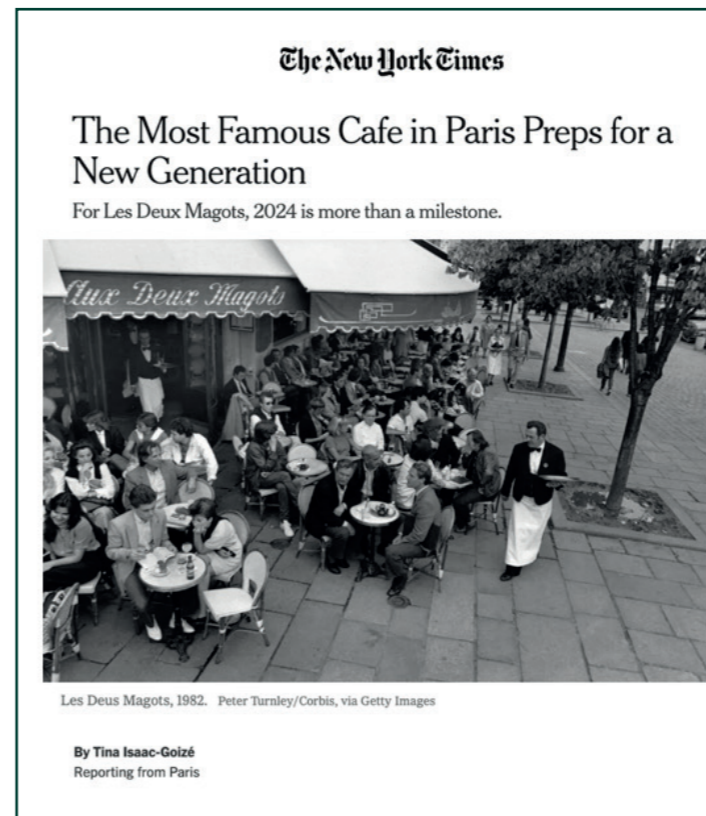
Article consacré aux Deux Magots dans le New York Times, septembre 2024