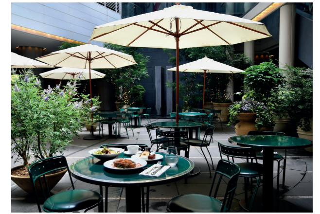
Les Deux Magots à Tokyo

La marque rayonne à l'international relayée par des médias prestigieux. Depuis 1989, la Maison partage également son esprit parisien à travers le monde, notamment avec une première implantation à Tokyo, au Japon. En 2023, les Deux Magots s'installe à Riyad en Arabie Saoudite et à São Paulo au Brésil, avec des projets d'expansion dans d'autres grandes villes. L'objectif est de partager l'art de vivre Paris au quatre coins du monde, tout en préservant l'exclusivité et l'authenticité de la marque.