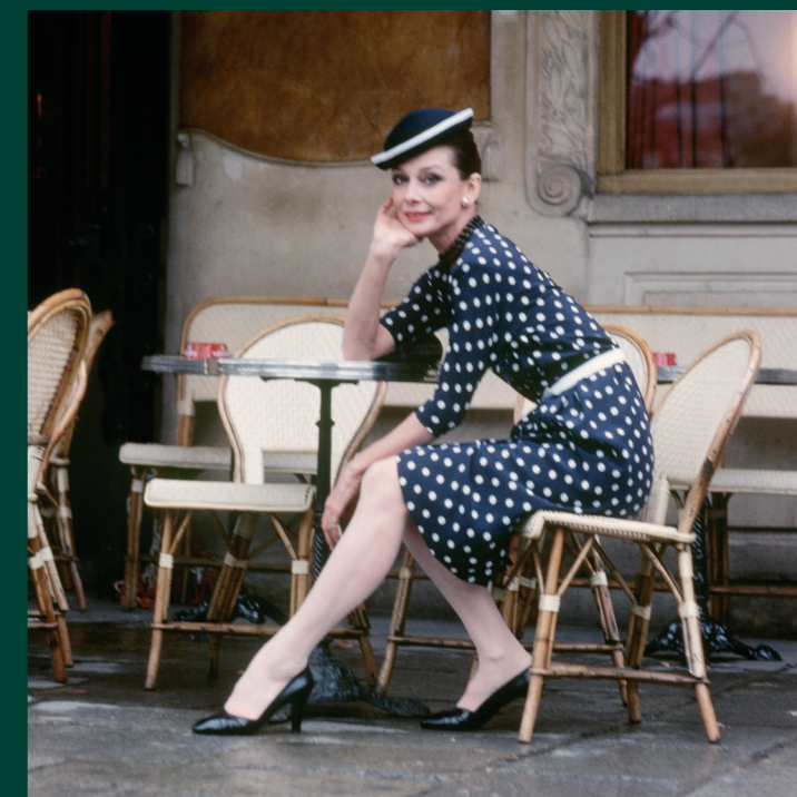
Audrey Hepburn aux Deux Magots, 1979

Les Deux Magots est la scène d'un grand théâtre culturel où se jouent de belles pièces depuis sa création. Nourrie par l'aura artistique du quartier de Saint-Germain-des-Prés, la Maison a accueilli entre ses murs les plus grands : du poète Paul Verlaine au réalisateur J.J. Abrams, en passant par Ernest Hemingway, Pablo Picasso, Simone de Beauvoir, Jean-Paul Sartre, ou encore Paul McCartney et des stars venues du monde entier. Ce lieu emblématique a vu éclore le surréalisme et l'existentialisme, a vibré au rythme des zazous et a incarné un esprit de liberté tout au long du siècle. Ancré dans son histoire et son quartier, le café littéraire continue de s'imposer, aujourd'hui, comme un bastion intemporel de la création où artistes et anonymes viennent chercher l'inspiration, ou refaire le monde.