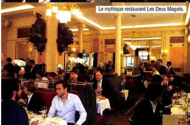
Le mythique restaurant Les Deux Magots.