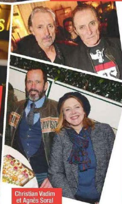
Christian Vadim et Agnès Soral