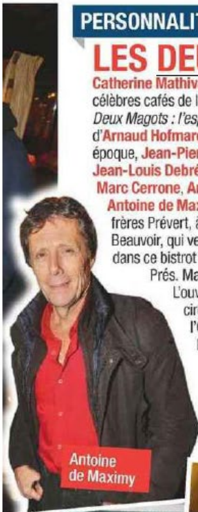
Antoine de Maximy